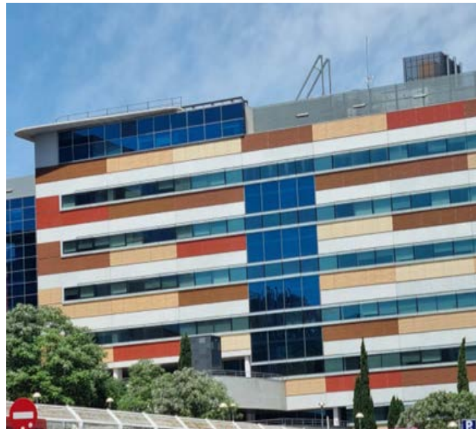
Rehabilitación de edificio en las Tablas. Madrid.