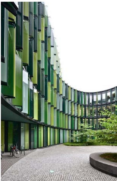
Sauherbruch y Hutton