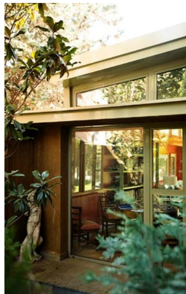
Barrio histórico. Málaga