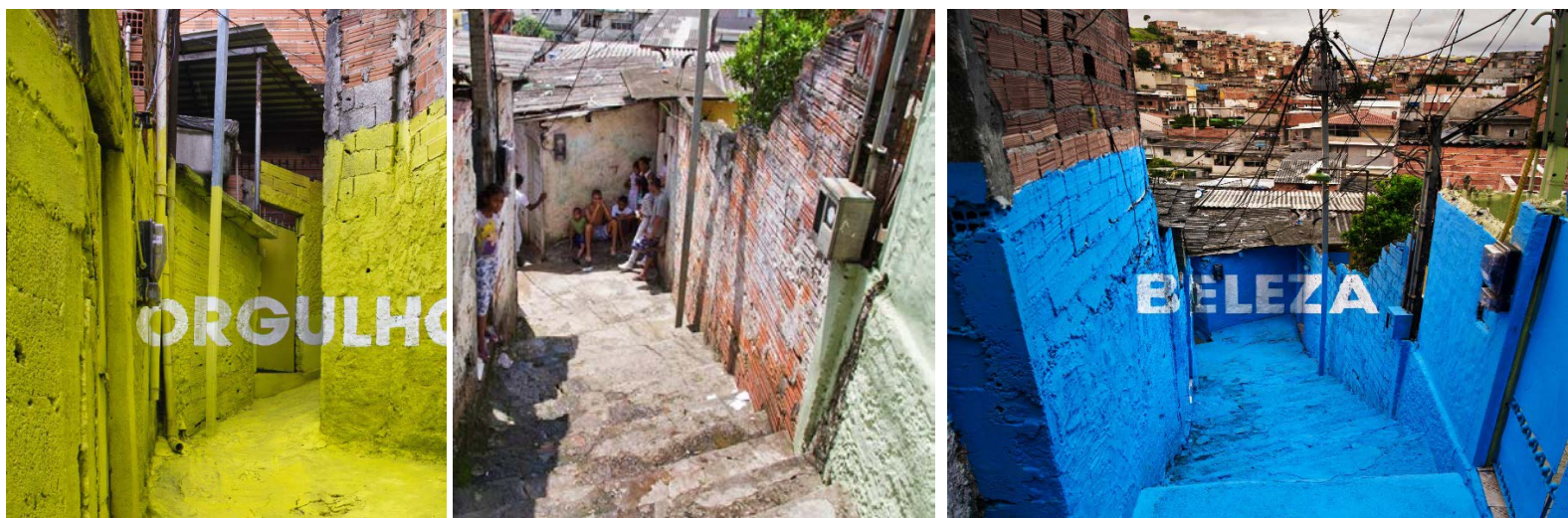
Intervención en las Favelas de Sao Paulo. Grupo Boa Mistura

NOTAS: El alumno tendrá que poder manejarse en alguno de los programas del entorno Acrobat -Photoshop-, y se le dará los enlaces para descargarse la paleta digital NCS.